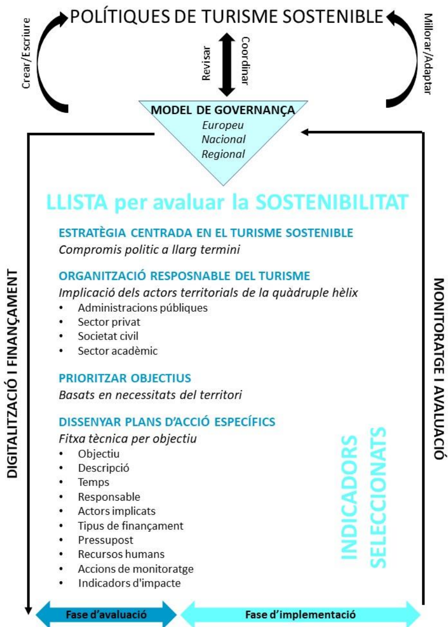
Figura 1. Esquema de la via recomanada per a la implementació de polítiques de turisme sostenible fent ús de les eines proporcionades en aquesta guia. El model òptim de governança per redactar i adaptar polítiques de turisme sostenible a tots els nivells (Europeu, Nacional i Regional) recomana seguir les pautes de la llista de verificació per aconseguir tenir una estratègia centrada en el turisme sostenible a llarg termini. Pel desenvolupament correcte d'aquesta estratègia és necessari la creació d'una organització responsable del turisme amb la implicació dels actors territorials de la quàdruple hèlix. Aquesta organització, mitjançant equips de treball, caldria que prioritzés objectius basats en les necessitats del territori i dissenyar plans d'acció que contemplin una fase d'implementació amb accions de monitoratge a través d'indicadors seleccionats i una fase d'avaluació per a la millora i adaptació del pla d'acció. Aquest procés hauria d'anar acompanyat de la digitalització de les tasques i finançament constant per permetre el monitoratge i avaluació adequats, fent efectiva, periòdicament, la revisió i actualització de les polítiques de turisme sostenible.