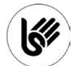
Llengua de signes