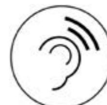
So amplificat individual