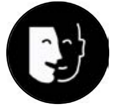
Accessibilitat intel·lectual o psíquica