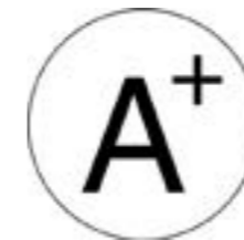
Macrocaràcters o ajudes òptiques