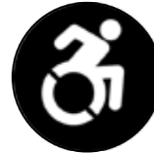
Accessibilitat motriu o física