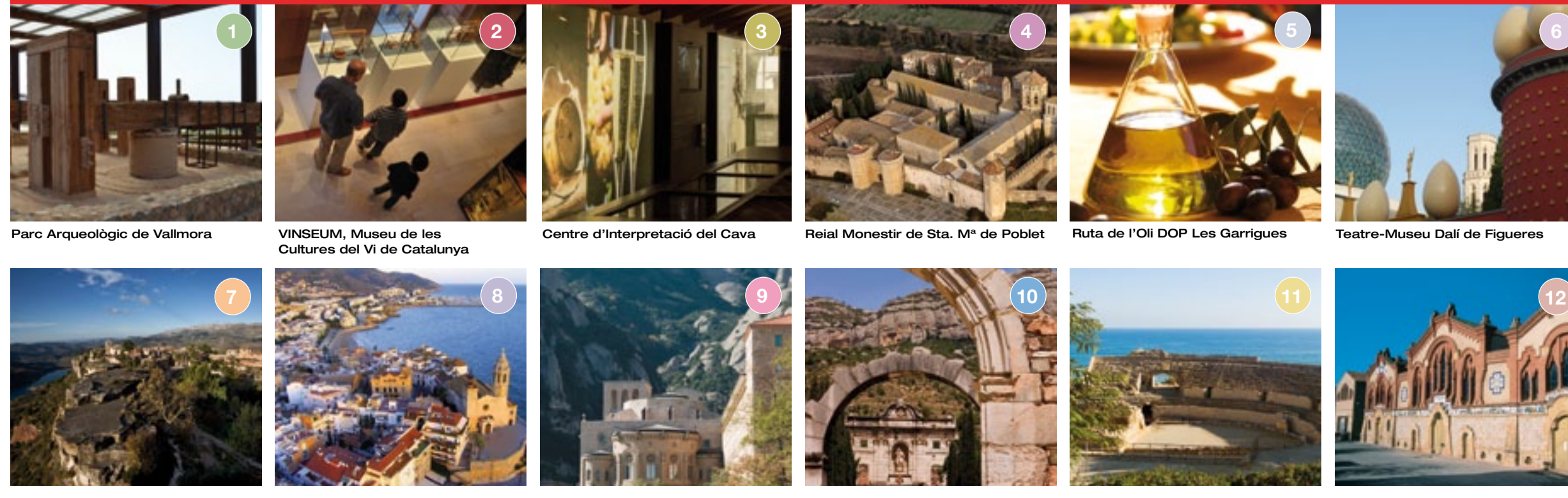
1 Parc Arqueològic de Vallmora 2 VINSEUM, Museu de les Cultures del Vi de Catalunya 3 Centre d'Interpretació del Cava 4 Reial Monestir de Sta. Mª de Poblet 5 Ruta de l'Oli DOP Les Garrigues 6 Teatre-Museu Dalí de Figueres 7 Siurana 8 Sitges 9 Montserrat 10 Cartoixa d'Escaladei 11 Tarragona (Tàrraco romana) 12 Celler Cooperatiu de Pinell del Brai