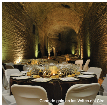
Cena de gala en las Voltes del Circ