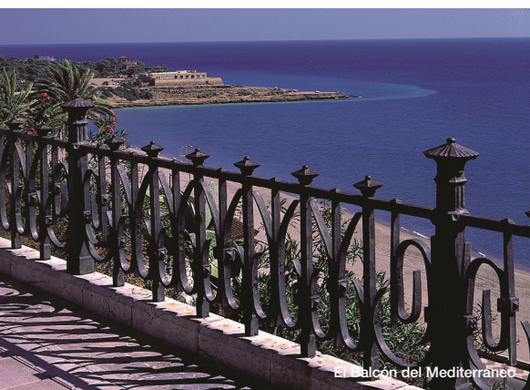
El Balcón del Mediterraneo