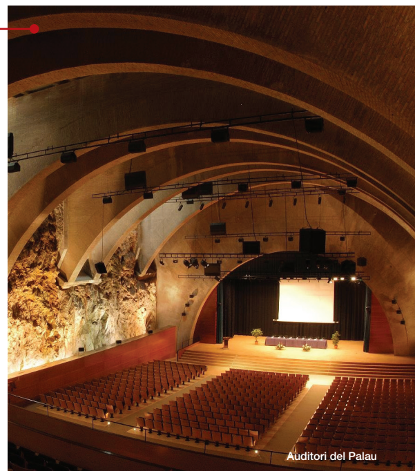
Auditori del Palau