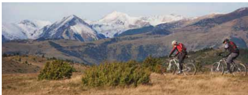
VTT au col d'Arès, régions de Ripollès et de Vallespir.

A Gérone, la Costa Brava se fond avec les montagnes des Gavarres et les Pyrénées à travers des routes attractives avec des étapes dans des localités telles que Calella de Palafrugell, Castell-Platja d'Aro, Sant Feliu de Guíxols, Lloret de Mar ou Blanes. Depuis la côte du Maresme, avec Malgrat de Mar, Santa Susanna et Calella comme points de départ, un cercle vert de cinq parcs naturels dans les alentours de Barcelone, visitant des lieux emblématiques, comme Montseny, el Montnegre ou Montserrat. Dans le sud, le littoral de Tarragone est la porte d'entrée aux courses bucoliques de Montsant, la Serra de Prades et les Ports de Tortosa-Beseit, depuis Cambrils, Mont-roig del Camp, Miami Platja et Sant Carles de la Ràpita.