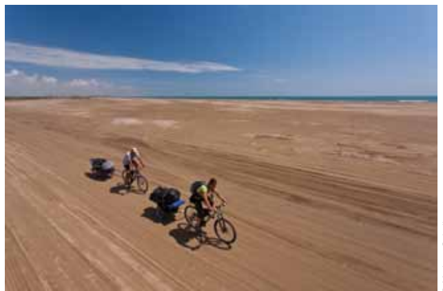
Platja del Trabucador, Ebrodelta.