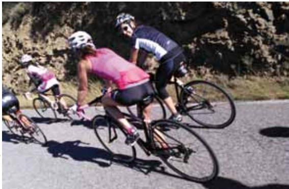
Rennen Mont-roig del Camp.

31 Rennen el Pavo 26. Dezember Volkslauf. www.mont-roig.cat